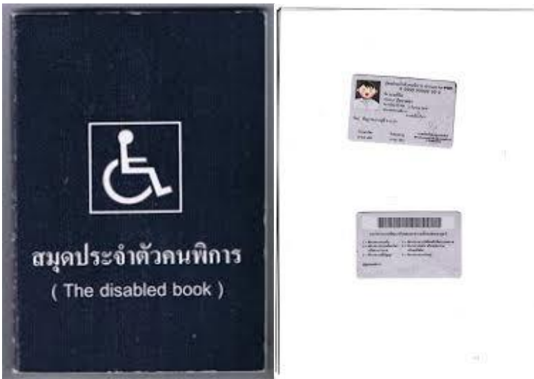
ตัวอย่างบัตรและสมุดประจำตัวคนพิการ